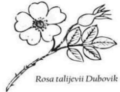
Rosa talijevii Dubovik